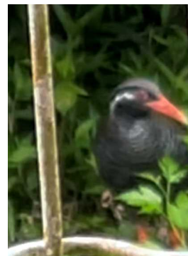
YouTubeで鳴き声を聞かせたら顔出した。