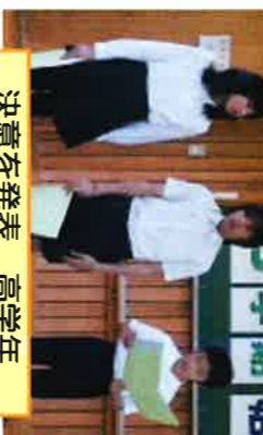
決意を発表 高学年