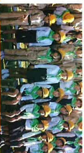
安田小緑の少年団！