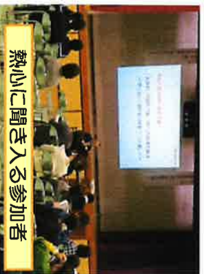
熱心に聞き入る参加者

令和元年12月5日(木)に、国頭中学校体育館にて、国頭村学推実践報告会において 村へき地校代表 で本校の学推実践報告をさせて頂きました。まず、 授業改善部会 の取組では、研究授業・互見授業の様子や村へき地三校の合同学習について発表！次に、 つながり改善部会 では、(1)夢・希望を育む活動では、①夢・目標の設定の取組 ②家庭学習強化月間の取組 ③キャリア教育講話(2)その他の取組 『 地域とのふれあい・絆づくり 』では、①安田区慰霊祭への参加 ②安田大スヌグ ③方言教室 『 人・もの・ことをつなぐ 』では、①特設授課「ヤンバルの自然の魅力」②出前授業「MESH:プログラム」③学推改善部会では、今年度の実践・プロセス【重点取組事項】 学校長の経営方針 や経営ビジョンを全職員が共有し、全校の協力体制を確立し、マネジメントサイクルに基づいた教育活動の実践等について、プレゼン資料を使って発表しました。実践研究の道半ばではありますが、今後とも研究・研修を重ね、教職員・児童の学びを深めたいと思います。