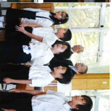
校歌を元気に歌う安田っ子と先生